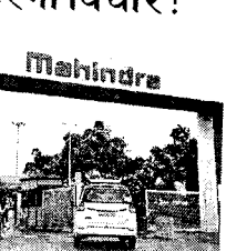
साल 2030 तक ईवी पेश करेगी कंपनी

प्रमुख वाहन कंपनी टाटा मोटर्स वित्त वर्ष 2024-25 में नए उत्पाद पेश करने पर और प्रौद्योगिकियों के लिए 43 हजार करोड़ रुपये का निवेश करेगी।